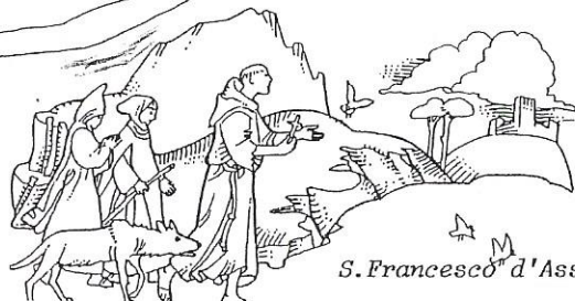
S. Francesco d'Assisi

DOVE RIFORNIRSI DI QUESTA PACE? LE NOSTRE COMUNITA' CRISTIANE NE SONO RIFORNITE? COMUNICHIAMO PACE?