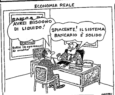
da IL CORRIERE DELLA SERA, 22 gennaio

PROSSIMAMENTE: Pubblicazione del bilancio semestrale di cassa