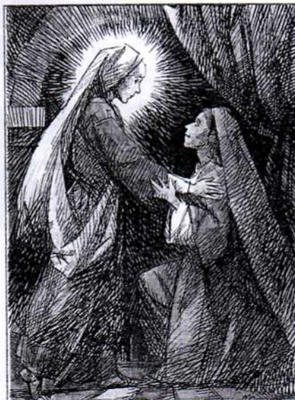
Elisabetta fu colmata di Spirito Santo ed esclamò a gran voce: «Benedetta tu fra le donne e benedetto il frutto del tuo grembo!».

3 Egli si leverà e pascerà con la forza del Signore, con la maestà del nome del Signore, suo Dio. Abiteranno sicuri, perché egli allora sarà grande fino agli estremi confini della terra. 4 Egli stesso sarà la pace!».