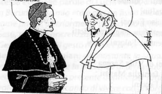
da "ToscanaOggi" - 21/11/14

NIENTE CUFFI E ROSICONI? SEMPRE MELIO DEL PD, ALLORA!