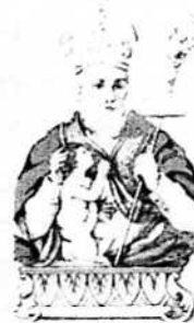
S. BIAGIO VESCOVO

Vissuto tra il III e il IV secolo a Sebaste in Armenia (Asia Minore), era medico e venne nominato vescovo della sua città. Morì decapitato dopo un atroce martirio. Sepolto nella cattedrale di Sebaste, durante il trasporto dei suoi resti a Roma, nell'anno 732, in seguito ad un naufragio, l'urna fu portata a Maratea dove è ancora venerata nella regia cappella sul monte san Biagio.